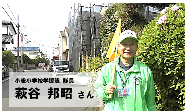
小雀小学校学援隊 隊長