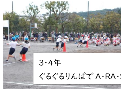
3・4年 ぐるぐるりんばで A・RA・SHI を起こせ