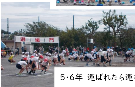
5・6年 運ばれたら運び返す恩返しだ