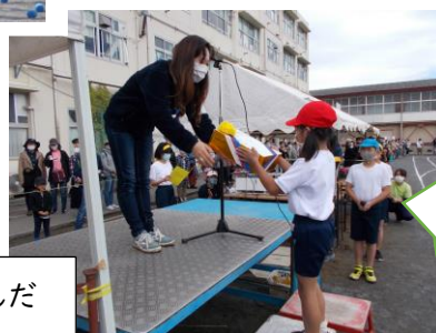
最後に PTA 会長さんから参加賞をいただきました。