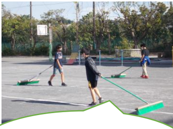
金曜日の午後 5・6年生が準備をしました。

10月18日スポーツフェスティバルが行われました。子どもたちの元気な笑顔がはじけました。