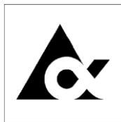
テトラパックのマーク