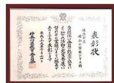
神奈川県教育委員会表彰