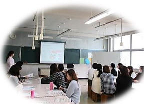
ハマ弁試食会&食育セミナー