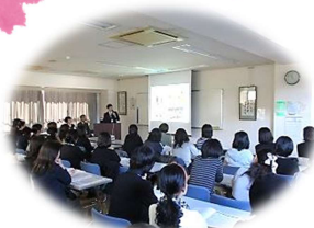
すすき野中学校見学会