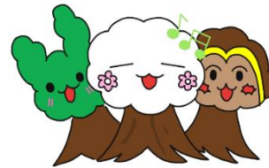
コフシング くすのきらビット サルスベッホー