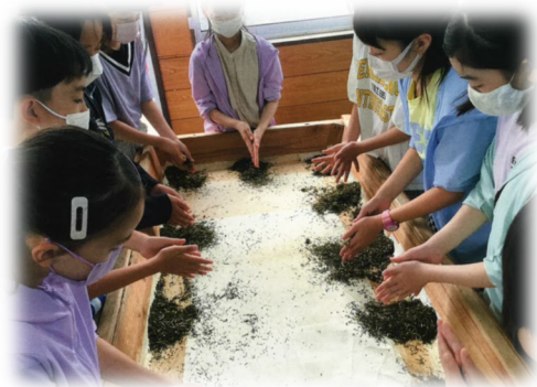
5年生 清水宿泊体験学習