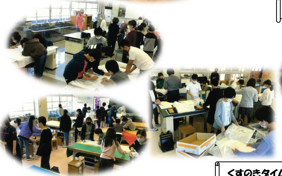
くすのきタイム 6年生は係の仕事もしています。

【新型コロナウイルス感染予防、感染拡大防止についてお願い】 ・登校前に各家庭で検温してロイロノートによる健康観察を行い、児童本人や同居の方が体調不良（発熱、せき、倦怠感、息苦しさ、頭痛の症状等）の場合は登校を見合わせてください。 ・児童が感染した場合、濃厚接触者となった場合、PCR検査を受ける場合や、同居家族がPCR検査を受ける場合は、学校まで連絡をお願いいたします。検査結果が判明するまでの間、当該児童生徒の登校を控えて、家庭で健康観察をしていただくようよろしくお願いいたします。 ・児童が濃厚接触者と特定された場合、PCR検査の結果が陰性でも14日間の健康観察期間内は、登校できません。