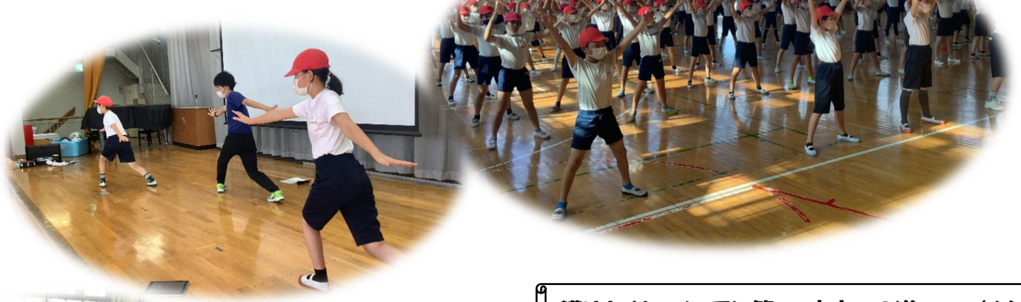
獲りまくれ ソーラン節 ～未来への道へ～ (6年生)