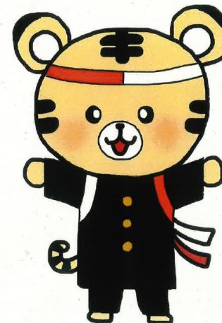
第2部応援キャラクター 【ファイヤータイガー】