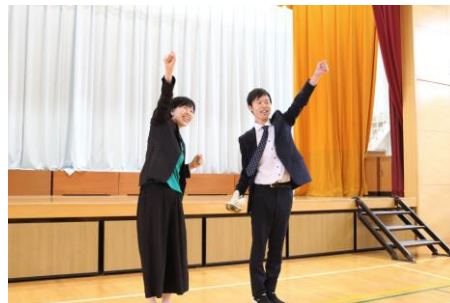
5年 大好き！本気！積極的！ みんなで やりきる 大きな木