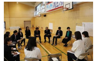
2チームに分かれての意見交換会