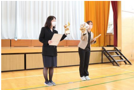
1年 ぐんぐん きらきら 1年生！

その後行われた懇話会は先生と保護者が二つのグループに分かれ、家庭でのゲームや携帯電話の使い方、放課後の遊びについての意見を交換しました。「先生」と「保護者」の垣根を越えて貴重なお話をすることができ、短い時間ではありましたがとても有意義な時間となりました。