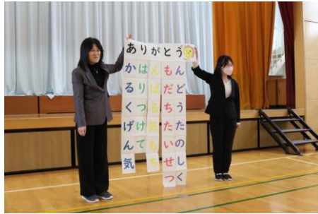
2年 にここにほかほか ありがとう