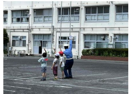
みんなびしっと手をあげて