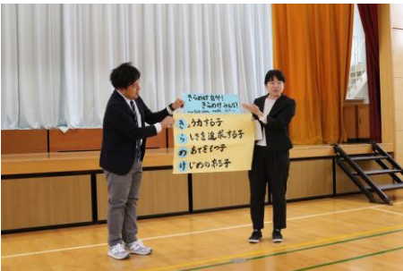
4年 きらめけ 自分！ きらめけ みんな！ ～We can make it!!～