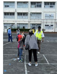
校外生活委員さん、ありがとう