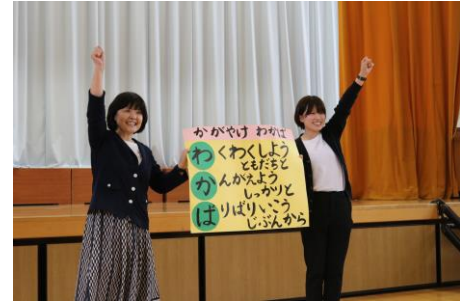
3年 かがやけ わかば わくわくしよう 友だちと かんがえよう しっかりと ぱりぱりいこう 自分から