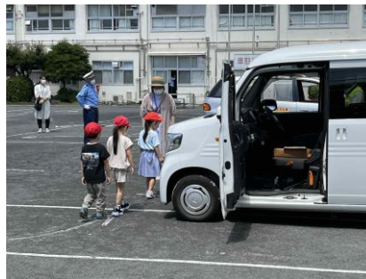
駐車車両の前後は特に気を付けてね