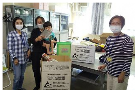
専用の回収箱にテトラパックを詰めて発送しました