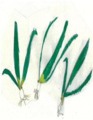
(絵・2-1 よし原 りんか)

たまねぎのねっこが小さいのに、大きい玉ねぎの体をささえられるのは、さいしょにしっかりうえている人がいるからかなと思いました。みんなががんばってうえた玉ねぎが1年生によるこんでもらえるといいです。