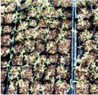
種から育てました。450個あります。

でコスモスとアリッサムの花の苗を配布いたします。苗を入れるふくろを、もってきてください。一人二つまでです。 花の育て方の説明書を用意しているのでもらってください。