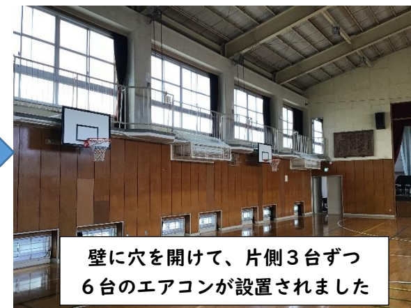
壁に穴を開けて、片側3台ずつ6台のエアコンが設置されました

正直、こんなに天井が高いのにエアコンなんて効くのかなと思っていましたが、これがとっても涼しいです！朝など気温が低いときは、寒いほどよく効きます。今後、説明会など保護者の皆様にお集まりいただくときにも、夏は涼しく冬は温かくお迎えできるのではないかと思います。ご期待ください！