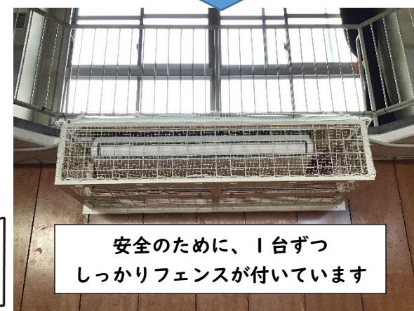
安全のために、1台ずつしっかりフェンスが付いています