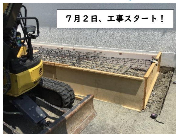
7月2日、工事スタート！

夏はサウナ、冬は冷凍庫のようだった体育館。夏の体育の後は、体調不良者が出ることもありました。しかし今年ついにエアコンが設置されることになり、7月から工事が始まりました。工事は夏休み中も順調に進み、全部で6台のエアコンが無事設置完了！先週からは、試運転も始まりました。