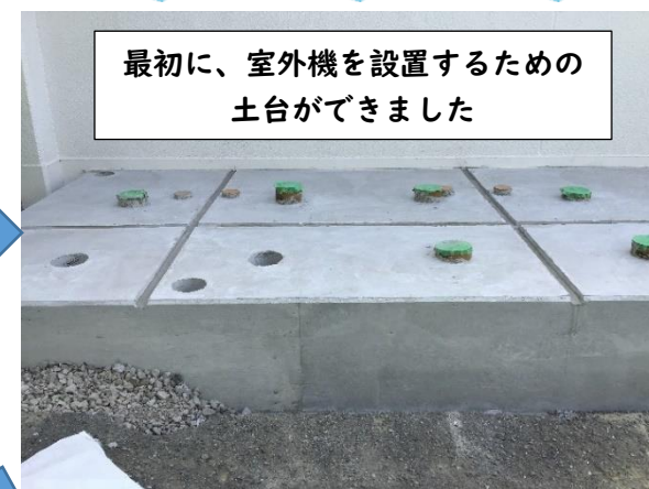
最初に、室外機を設置するための土台ができました