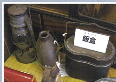
飯盒(はんごう)水筒