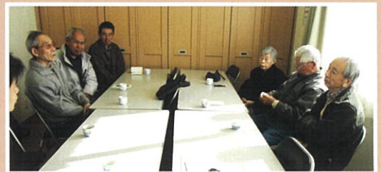
戦争体験を聞く会