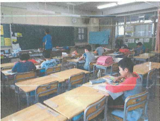
鉄道の写真を使って 鉄道写真集を作る 様子