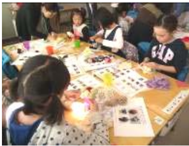
ポコポココミュニケーション&ポコス