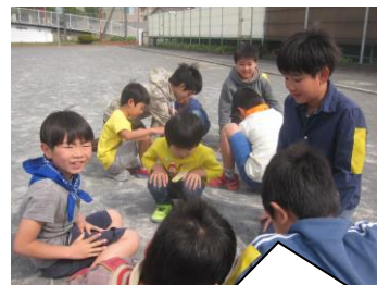
全校のみんなで、ゲームを楽しみました。

こうして上菅田小学校の大切な仲間になった1年生。給食も始まり、元気に学校生活を送っています。たくさん学んで、たくさん遊んで、学校生活を思い切り楽しんでほしいと思います。