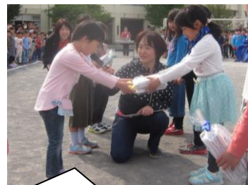
2年生からプレゼントをいただきました。