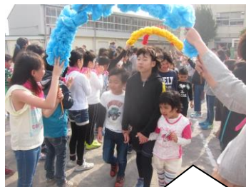
6年生のお兄さん、お姉さんと入場しました。

4月11日（水）の1校時に、〈入学おめでとうの会〉を行いました。お兄さん、お姉さんに迎えられて、1年生も上菅田小学校の仲間入りをしました。歌やゲームなど1年生を迎えるいろいろな取組を行い、1年生もとても楽しそうでした。