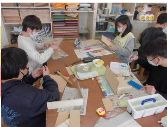
糸のこで切った材料に色を塗っています