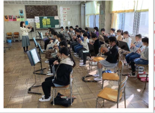
お世話になった6年生のために

5年生になって取り組み始めたアルトリコーダーですが、徐々に指運びにも慣れ、美しい音色を奏でられるようになってきました。今は「威風堂々」に挑戦しています。3月の卒業式の卒業生退場にて、5年生の「威風堂々」の録音を流す予定です。卒業生が退場時に一步一步小学校生活の思い出を踏みしめられるように、力強く、重厚感のある演奏を目指し、特訓を続けていきます。