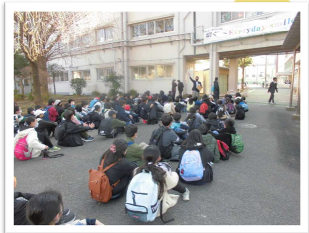
中学校の先生のお話を真剣に聞いています！

1月20日（金）に、6年生は瀬谷中学校に行ってきました。授業の様子を見て「社会の課題が面白いね。」「英語はスピーチの練習をしている。自分たちもやっているから生かせそう。」部活動の様子を見て「どの部も先輩が中心になって良い雰囲気。」と話していました。帰り道、「何部に入ろうかなあ。」「中学校に入るのが楽しみになった。」という声も聞こえてきて、小学校を卒業した後の自分の生活を少し思い描くことができたようです。