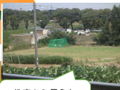
教室から見えた ネット

教室から見える畑に、8月末に突然ネットが出現。よく見てみると何やら木の箱のようなものが…。「テレビとかで見るミツバチの巣じゃない?」「見に行ってみたいね。」などと話していたところ、ある日作業をしている人が!そこで突撃インタビューに出かけました!そこでは予想していたようにミツバチを育てている、その方はミツバチに近づくスズメバチを駆除されているところでした。「実際にやっている人は今日はいないんだ。」とのことで、子どもたちは育てている方に詳しいお話を聞いてみたいと考えています。7月に校内で見かけたたくさんのミツバチはここから飛んで来ていたのかも…と話しています。