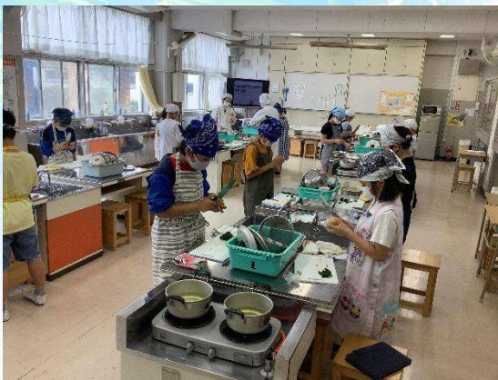
じゃがいもの芽をとっています