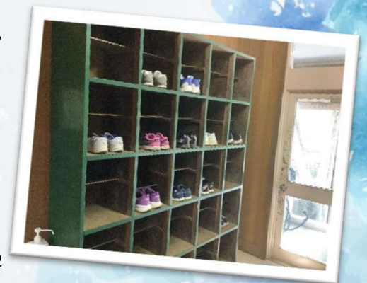
よい習慣が身についています。