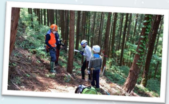
力を合わせて間伐！