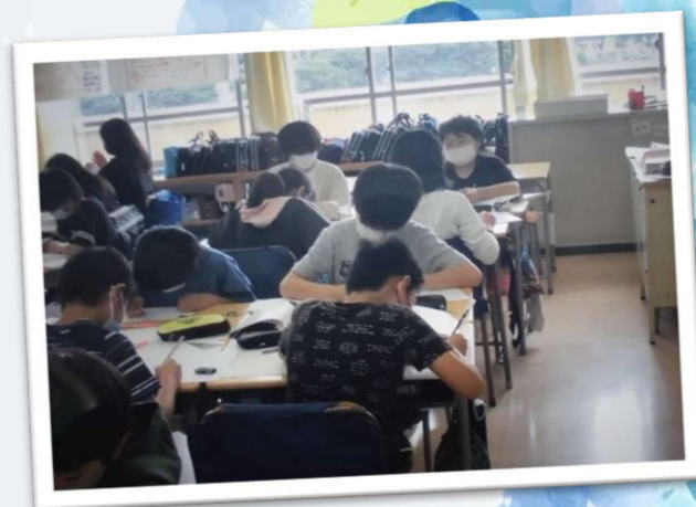
学習にも真剣に取り組めます

よりよい学校づくりを実現していくためには自分の考えを表したり、出てきた考えをまとめたりしていく力も求められます。学習の中でも、表し方を自分で考えたり、悩んだときには友達に相談したり。そうやって力を高め、自信がついてくれば、6年生として自分ができることも増えるはず！これからつくっていく力を毎日少しずつ高めています！