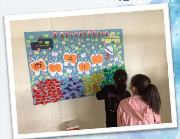
6年生からのメッセージ

また、次の日に学校に行くと、廊下に6年生からの「おかえり」のメッセージがはってありました。6年生の思いやりや学校スローガン「輪」を意識した行動に触れました。少しずつではありますが、来年度上瀬谷小学校をひっぱり存在になるために、様々なアンテナを張って考えを実行する6年生の姿をよく見て自分たちの行動に反映させてくれたらと思います。