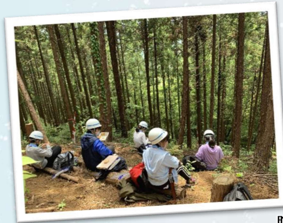
力仕事後のお弁当

いざ、のこぎりを持って木を切ると立っている木を切ることや、ロープを引っ張って倒すことの大変さを実感しました。木は倒れはじめると一瞬で、めきめきと音を立てたかと思うと、狙った方向へ正確にゆっくりと倒れていきました。倒れた木の周辺は新鮮なスギやヒノキの香りでいっぱいになりました。