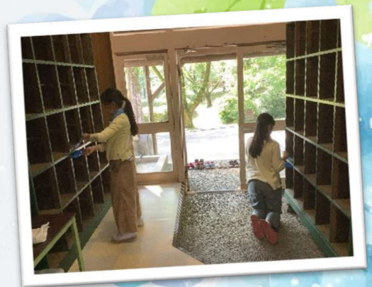
来たときよりも美しく

ロッジの掃除も学校とは異なる用具を使うことでいくらか戸惑いはありましたが、見えないところまで腰をかがめてていねいに取り組んでいました。実はこの掃除の姿勢は学校の掃除の時間でも見られていましたので、いつもの学校生活で身についた習慣が校外でも発揮されていました。また、下駄箱に靴を入れるときも学校同様にかかとをそろえていました。見てください！美しい下駄箱。