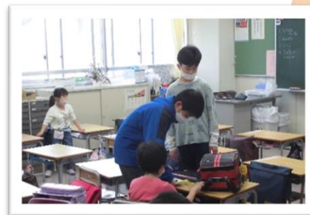
朝の準備も1年生と一緒に！

小学校生活の全てが初めての1年生。朝の準備、ランドセルの片付け方、机の中に入れるもの・・・慣れるまでは大仕事、6年生がサポートに行っています。「自分たちも、5年前、こんな風に、6年生がサポートしてくれていたんだね。」目には見えない大切な伝統を感じています。