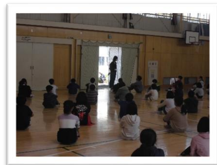
校長先生の思いに背筋も伸びます！

6年生としての生活がスタートして1週間、子どもたちは、自分たちの意識を高くもって過ごそうとしています。4月8日にはさっそく学年集会を開き、思いいっぱいの卒業の日を迎えるために、上瀬谷小のために力を惜しみなく発揮してほしいという話をしました。その姿勢、話を聞く雰囲気、張り詰めた空気に真剣さを感じました。これからの活躍が楽しみです！