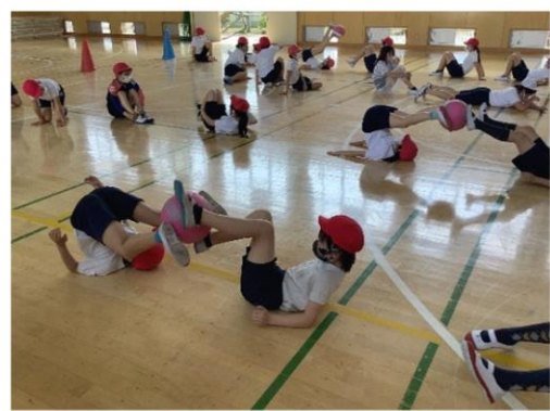
足ボールリレーの様子

国語でのグループ活動、算数での教え合いなど、様々な教科でチームワークが問われる活動を取り入れています。今回は、体育の足ボールリレーでチームワークを試しました。最初は足から足へとボールをつなぐことに悪戦苦闘し、リズムよくつなぐことができませんでしたが、繰り返すうちにどんどんとスムーズにボールをつなぐ姿が見られるようになりました。渡す人と受け取る人の足の開き方や高さを変えてみたり、声を出しながらつないでみたりと、工夫しながら取り組んでいました。さらに、技術面でのチームワークだけではなく、取り落としてしまった友達に「大丈夫！」、遅れたチームに「頑張れ！」と声を掛けるなどして、心と心のつながりにより素敵なチームワークを発揮していました。