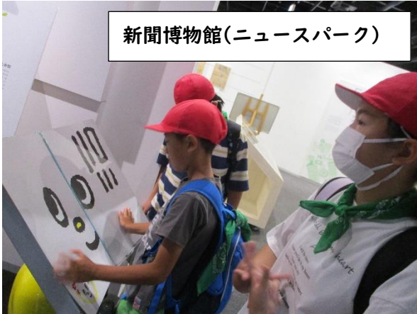
新聞博物館(ニュースパーク)

私は、ふれあいコンサートで、演奏端末で聴くより、すごい迫力があつたので驚きました。自分が楽器の見たい部分を見ることができてよかったです。よく見たり、聴いたりしていると、どの楽器が演奏しているのかが分かっておもしろかったです。生のオーケストラの演奏を聴いて、クラシック音楽に興味を持ちました。私が、今日聴いた中で気に入ったのは、行進曲「威風堂々第1番」です。理由は、曲全体の流れや雰囲気が好きだからです。会場にあつたほぼ全部の楽器を使って演奏をしてとても魅力的でした。