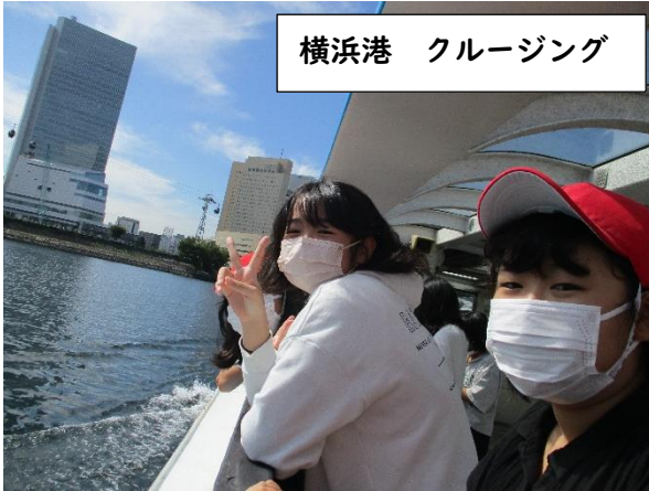
横浜港 クルージング

9月26日(火)に横浜港や新聞博物館を見学したり、みなとみらいホールで音楽鑑賞をしたりしました。『本物を見て・聞いて・感じて学ぼう！真の高学年としてマナーを守って行動しよう!!』というスローガンのもと、集団行動を意識して、様々な体験をすることができました。