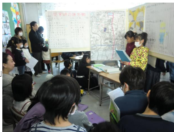
かみいだ 発(はっ)表(びょう)し(おお)て(おお)いる(おお)よう(おお)す 上飯田(かみいだ)ワ(おお)ー(おお)ル(おお)ド(おお)で(おお)発(おお)表(おお)し(おお)て(おお)いる(おお)よう(おお)す

昨年(こぞ)の12月(がつ)15日(にち)(土)に(おお)実施(じっし)した(おお)上飯田(かみいだ)ワールド(おお)では(おお)、低学年(ていがくねん)と(おお)高学年(こうがくねん)の二(ふた)つに(おお)スローガン(おお)が(おお)分(わ)か(おお)れ(おお)ました(おお)。低学年(ていがくねん)は、「Let's enjoy ワールド! 話(はな)して、見(み)て、聞(き)いて、全(ぜん)力(りよく)で(おお)発(はっ)表(びょう)し(おお)よう!」高学年(こうがくねん)は、「高学年(こうがくねん)として(おお)すべて(おお)の(おお)人(ひと)の(おお)胸(むね)に(おお)ひ(おお)び(おお)か(おお)せ(おお)よう! 一(ひと)人(ひとり)ひと(ひとり)り(おお)が(おお)か(おお)が(おお)やく(おお)平(へい)成(せい)最(さい)後(ご)の(おお)上(おお)飯(い)田(だ)ワ(おお)ー(おお)ル(おお)ド(おお)」で(おお)した(おお)。上飯田(かみいだ)ワ(おお)ー(おお)ル(おお)ド(おお)は、生(せい)活(かつ)科(か)や(おお)総(そう)合(ごう)の(おお)時(じ)間(かん)を(おお)使(つか)った(おお)活(おお)動(どう)で(おお)子ども(こ)たち(たち)の(おお)思(おお)い(おお)を(おお)大(おお)切(おお)に(おお)試(おお)行(おお)さ(おお)く(おお)ご(おお)錯(おお)誤(おお)し(おお)な(おお)が(おお)ら(おお)ず(おお)準(おお)備(おお)を(おお)進(おお)め(おお)、全(ぜん)校(おお)の(おお)子ども(こ)たち(たち)や(おお)保(おお)護(おお)者(おお)、地(おお)域(おお)の(おお)方(おお)々(おお)に(おお)む(おお)け(おお)て(おお)発(おお)信(おお)する(おお)活(おお)動(おお)で(おお)した(おお)。