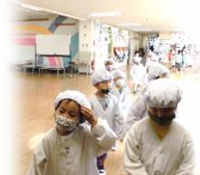
6月 第5週の時間割 (☆は、下校時刻です)