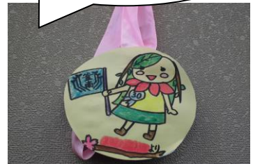
ニレーナちゃんのメダル