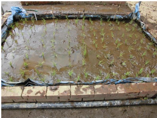
★みんなの手作業にて 田植え終了!!★