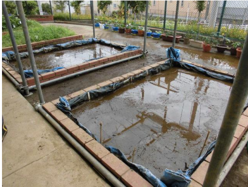
★しろかきをして田植えの準備 OK★

5年生は社会科の学習の発展として、総合の学習で米作りをしています。田起こしから始まり、しろかき、田植えと、地域のボランティアの方や、羽黒のJAの方々の協力をいただきながら取り組んでいます。