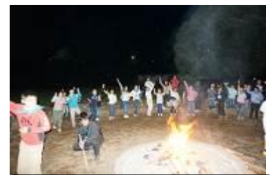
4・5年キャンプファイヤー

25日・26日、5年生・4年生は「愛川宿泊体験学習」に行きました。抜けるような青空と秋の風に包まれしっかりと活動することができました。5年生は藍染め体験、4年生は宮ヶ瀬ダム見学をしました。そのほかの活動は5年生と4年生がグループをつくり、一緒に行動しました。カレー作り、キャンプファイヤー、入浴、掃除、ウォークラリーなどでは、5年生が昨年の経験から4年生をリードする場面が見られ、「さすが5年生!」と感じました。体験学習の感想を聞くと「自分たちで作ったカレーがとてもおいしかった。」「夜、外でやったキャンプファイヤーの雰囲気よかった。」「朝食のバイキングがたくさん食べられておいしかった。」などの声が聞かれました。