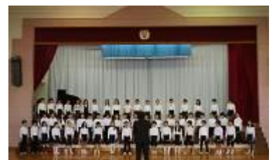
3年区小学校児童音楽会(練習)

29日、3年生が「金沢区小学校児童音楽会」に参加しました。夏休み前からリコーダーに取り組み「ミッキーマウスマーチ」を仕上げました。また、合唱では「君をのせて」(天空の城ラピュタ)を頑張りました。私も練習に関わりました。声の響きをそろえる練習をすると、きれいな響きにしようとして一生懸命に取り組みます。練習を重ねれば重ねるほどうまくなりました。23日には音楽集会があり、児童と保護者の前で披露することができました。その後も本番まで時間があつたのでさらに練習すると高音と低音の出し方が分かってきたようで、さらに良い響きとなりました。音楽会の始めの言葉を本校が担当し、1組のSさんが言いました。音楽会の発表を終えて感想を3年生に尋ねると、「歌がうまく歌えるようになってよかった。」「声の出し方が分かった。」「ほかの学校の合唱や演奏が聴けてよかった。」と発表の充実感が伝わってくる声が聞かれました。また、他校の児童が終わりの言葉を言いましたが、その中で釜利谷南小の「ミッキーマウスマーチ」をほめられ、とても嬉しかったようです。