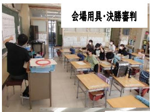
会場用具・決勝審判

26日(月)より運動会に向けての係活動が始まりました。今年度は、5、6年生が一緒になって運動会の活動を進めていきます。全校が一堂に会する久しぶりの運動会がよいよいものになるよう子どもとともに進めていきます。