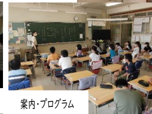
案内・プログラム