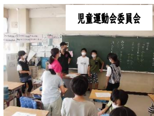
児童運動会委員会

26日(月)より運動会に向けての係活動が始まりました。今年度は、5、6年生が一緒になって運動会の活動を進めていきます。全校が一堂に会する久しぶりの運動会がよいよいものになるよう子どもとともに進めていきます。