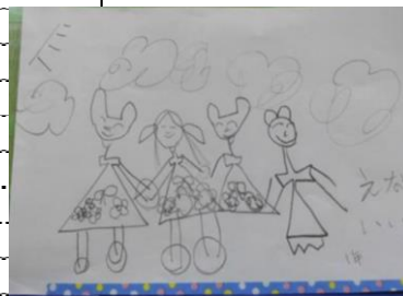
1年 いいづか えなさん作

☆読み聞かせについて 7月は5日(水) 7日(金) 12日(水) 14日(金) におはなしママ'Sさんが 読み聞かせに来てくださいます。