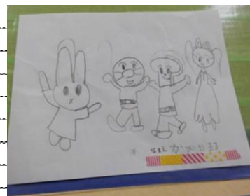
1年 かめや まきさん作