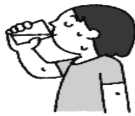
水分はこまめに、 回数を多めにとる