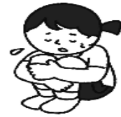
体調が悪いときはむりに 運動しない