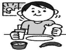
規則正しい生活で、 体調管理