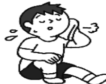
運動するときは こまめに休憩を