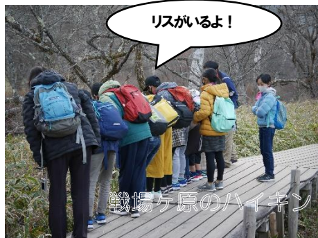
戦場ヶ原のハイキン