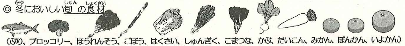
(ぶり、ブロッコリー、ほうれんそう、ごぼう、はくさい、しゅんぎく、こまつな、かぶ、だいこん、みかん、ぼんかん、いよかん)