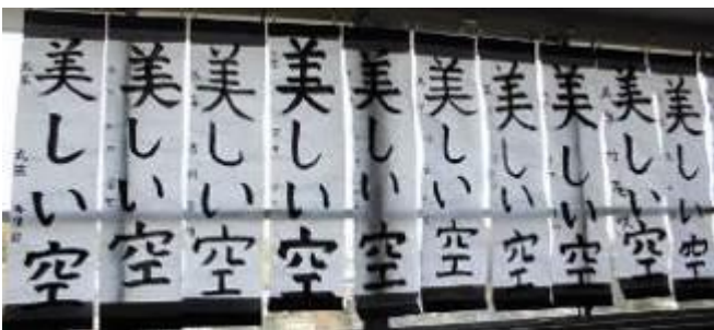
自分のめあてをもち、学習したことを活かして取り組みました。《5年生》