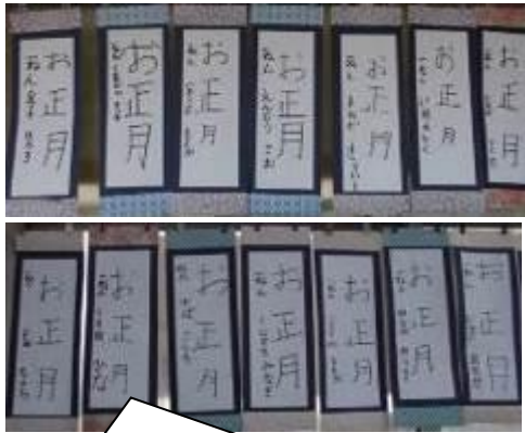
初めての書写展です。きれいな字を書こうと真剣に取り組みました。《1年生》