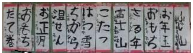
お正月らしい言葉を書きました。真剣な表情で最後まで丁寧に書きました。《4・5・6組》