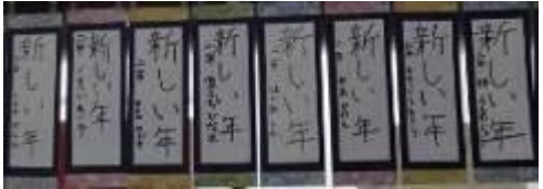
文字の形やバランスに気をつけて、何度も練習をして書きました。《2年生》