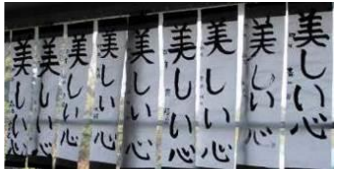
一人ひとりが自信をもって、心を込めて書くことができました。《4年生》