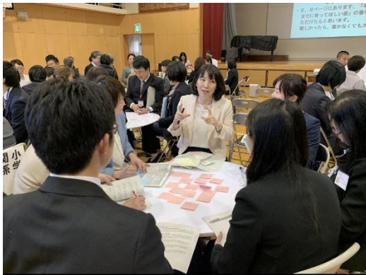
授業後 先生方の協議の様子

これからも、幼保小中を見通し、長い目で児童・生徒を育てていきたいと思っています。