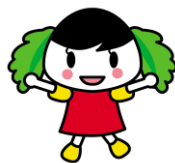
バランスイーナちゃん