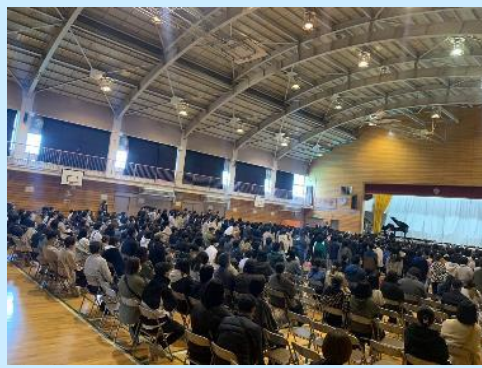
たくさんの保護者さまにご来場いただきました