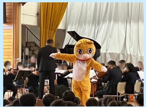
低学年の部ではニャンともかわいい猫が登場！