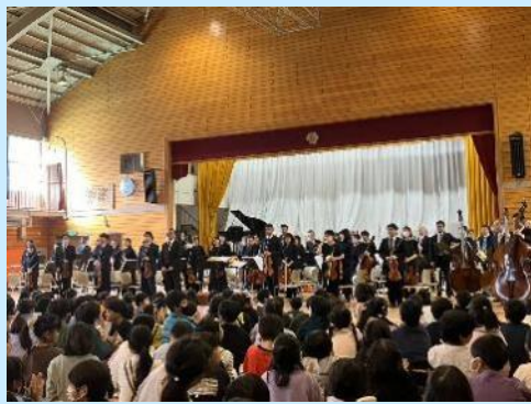
圧巻の演奏ありがとうございました

本郷中学校吹奏楽部によるグリラライブやボランティア協力、サポートいただきましたみなさま、ありがとうございました。