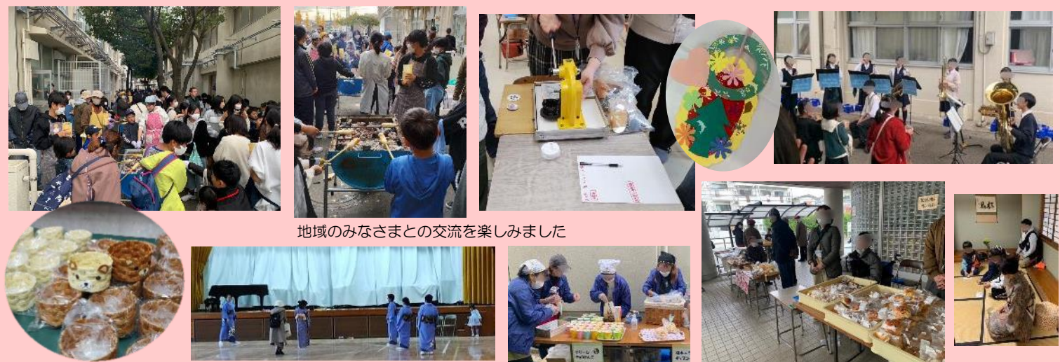
地域のみなさまとの交流を楽しみました