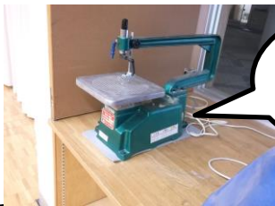
30年度配当予算で購入した物品の例