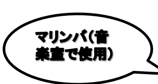
マリンバ (音楽室で使用)