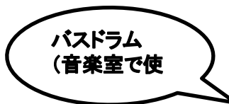
バスドラム (音楽室で使用)