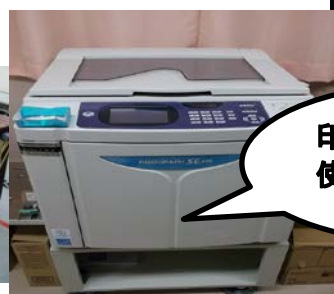
印刷機 (印刷室で使用)