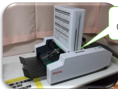
紙折機購入 (印刷室で使用)