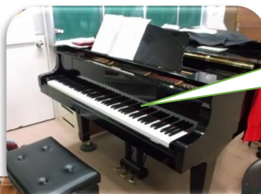
ピアノ鍵盤修繕 (音楽室)