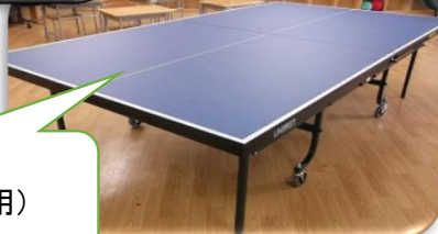
卓球台購入 (クラブ活動で使用)