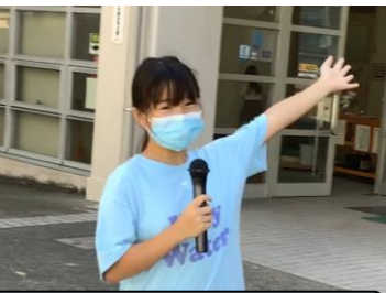
平小の実態を知り