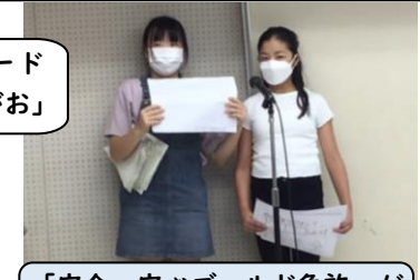
「安全・安心ゴールド免許」がもらえました！