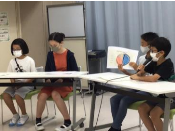
保健集会ではニュースを見て