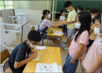
解答用紙を持っていくと