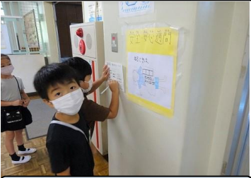
校舎内にあるクイズに答えて