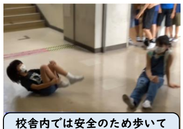
校舎内では安全のため歩いて過ごそうと考えました！