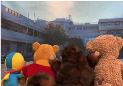
最後、みんなで仲良く遊びました。