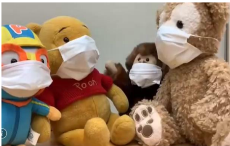
病気になったぶーさんを避けるのは、よくないと、周りの友達は気がつきました。