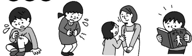
ケガをしたとき 体調が悪いとき 悩みや心配があるとき 体について学びたいとき