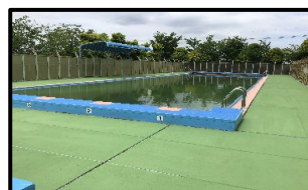
【プールサイド全面塗装】