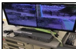
【門防犯カメラHD交換】