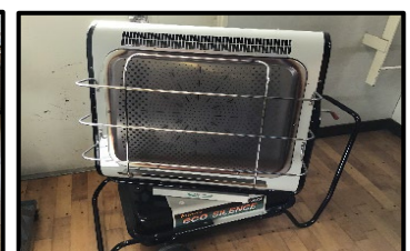
【体育館ジェットヒーター】