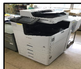
【職員室高速プリンター】

また、職員室には従来よりも安価に利用でき印刷速度の速いプリンターを導入し、教職員の業務効率化と経費の削減を図りました。