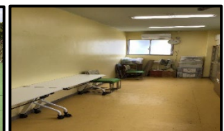
【地域交流室修繕(床、空調更新)】