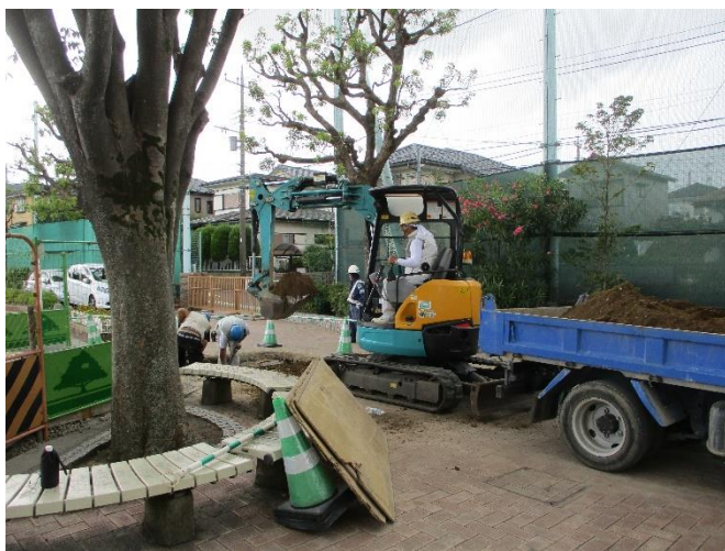
【地面を掘り起こして下水道管を埋設しています】

現在は、けやきの木から中央昇降口前あたりを工事しています。工期は9月末までの予定です。