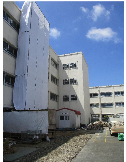
【中庭では工事用の足場を組んで作業しています】