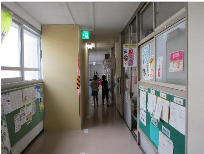
【校内では廊下の一部分を仮囲いして作業しています】

現在は、エレベーターを設置するための基礎工事をしています。工期は2月末までの予定です。