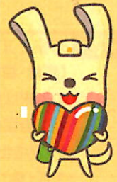
「ヨコハマ3R夢!」 マスコット イーオ