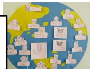
ピンクバンド・ラッキーワード

いっぱいあいさつがあってすごかったです。もっと外国のことばや人を知りたいです。自分は自分でいいんだと思いました。とても楽しかったです。歌も楽しかったです。また、いろいろ教えてほしいです。 (2年生)