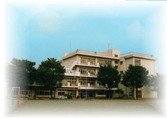
横浜市立平安小学校