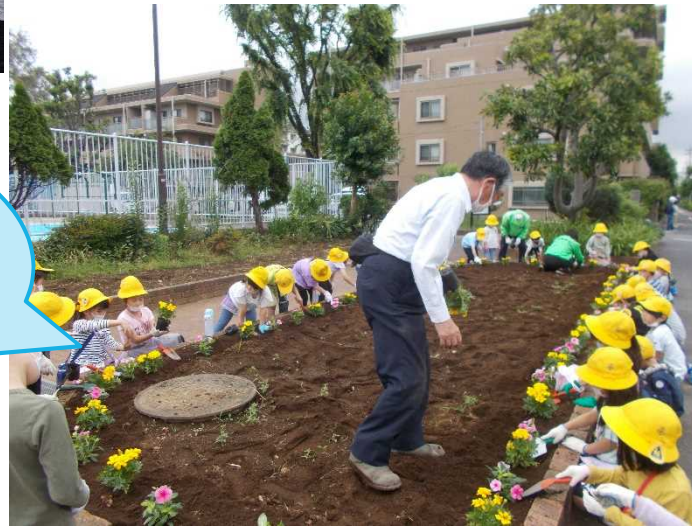
平安公園の 花植え

集団生活を通して、ルールの大切さや、友達とかかわるよさに気付いていくことができるよう、支援しています。