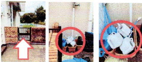
写真①：じょうろが置いてある水場(西門側)