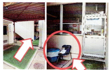
チェック表、手袋、 ゴミ袋、専用ゴミ箱