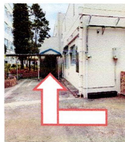
写真②：南校舎裏階段下