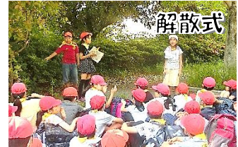
学年全員で力を合わせました。仲間へ感謝。