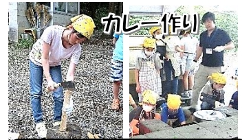
自分たちで薪を割り火をおこして、おいしいカレーができました。