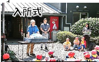
センターの方からシーツのたたみ方などを教わりました。