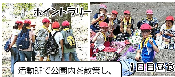
活動班で公園内を散策し、お弁当を食べました。