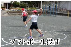
ソフトボール投げ

新体力テストは8種目で測定していて、毎年低中学年に分かれて3日間で実施しています。また低学年の日には、6年生が1・2年生のお世話をしたり測定の手伝いをしたりして実施しています。児童が自分の体力を知ること、今年の体育学習のめあてをもたせることにもつながっています。測定の記録は、健康手帳に記録しています。