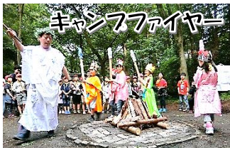
歌って踊ってゲームをして、大いに盛り上がりました。

前日の嵐のような天気から一転し、二日間とも天候に恵まれ、予定通りに活動することができました。小学校生活初めての宿泊体験学習でしたが、集団行動のきまりを守り、友達と協力していた4年生。野外活動の楽しさも十分味わうことができ、思い出に残るよい宿泊体験学習になりました。