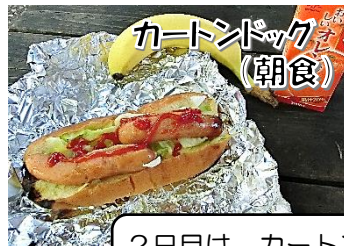
2日目は、カートンドッグと焼き板を作りました。